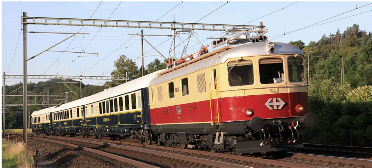
Charterfahrt 2009

Zum ersten Mal bieten wir eine öffentliche Fahrt mit den wunderschönen, frisch überarbeiteten Wagen des Prestige Continental Express mit Interieur im Belle Époque-Stil an. 2009 durften wir diese Wagen einmal für eine Charterfahrt nach Yverdon führen. Seither haben sie den Besitzer gewechselt und mussten technisch überholt werden. Das Ambiente in diesen Wagen ist einmalig und geht mit dem schönen und luxuriösen Orient-Express-Interieur direkt ins Herz. Unsere Re 4/4 I 10034 TEE führt den Zug wieder teilweise auf Strecken, die wir zum ersten Mal befahren, ebenfalls wieder mit interessanten Zwischenhalten. Lassen Sie sich überraschen!